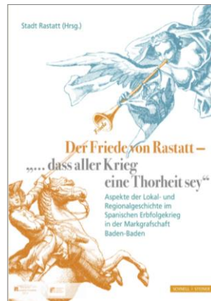
Rastatter Frieden 2014

Aus diesem Anlass haben wir bis zum Jahresende freien Eintritt und noch so manche kleine Überraschung.