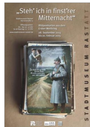
Steh'ich in finst'rer Mitternacht 2015

Aufgrund der Corona Verordnung ist ein Mund-Nasen-Schutz Pflicht.