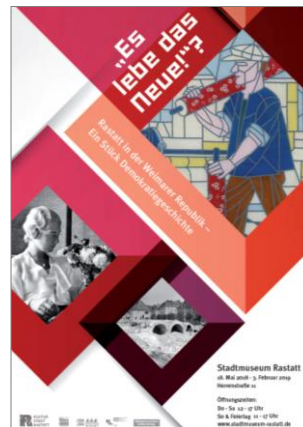
Es lebe das Neue 2019