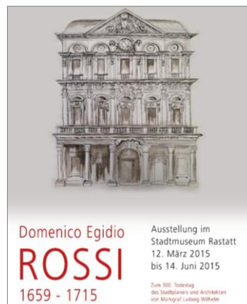
Domenico Egidio Rossi 2015