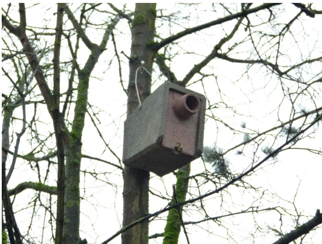
Abb. 3: Hangplatz eines Starennistkastens an einem Ahorn