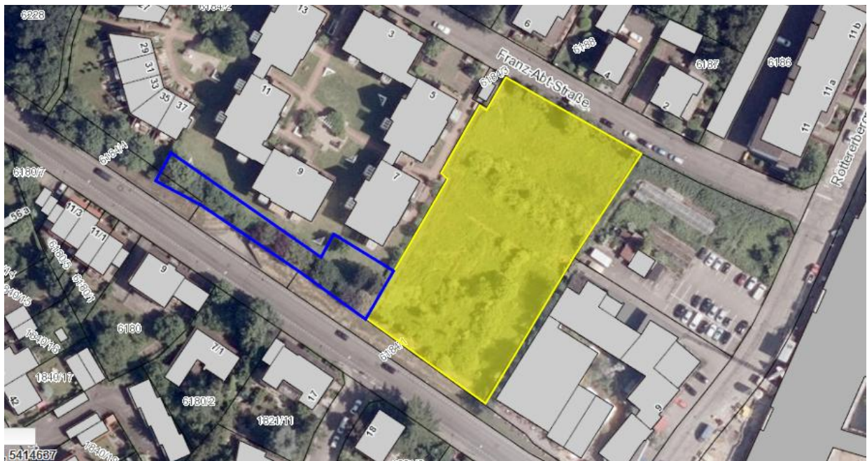
Abb. 1: Eingriffsfläche (gelb) und Standort der Nistkästen (blau umrandet)

Die folgende Abbildung zeigt den Eingriffsbereich und den Standort der angebrachten Nistkästen.