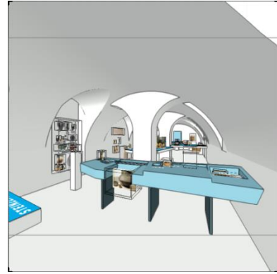
Virtueller Blick in den Gewölbekeller, in dem zukünftig die Archäologie des Landkreises zu sehen ist.

Hinter den Kulissen arbeiten wir fleißig an unseren Zukunftsprojekten. Eines davon ist der neue Dauerausstellungsbereich zur Mittelaltergeschichte und Archäologie. Die Auswahl der Museumsobjekte ist abgeschlossen und das Gestaltungsbüro entwirft die Optik.