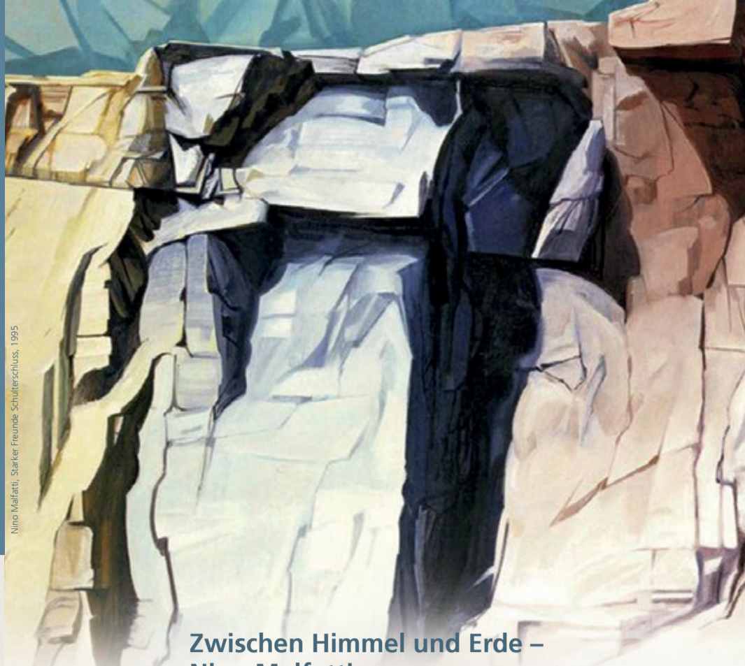
Nino Malfatti, Starker Freunde, Schlußschluss, 1995

3 €, ermäßigt 1 € Freier Eintritt mit Museumspass